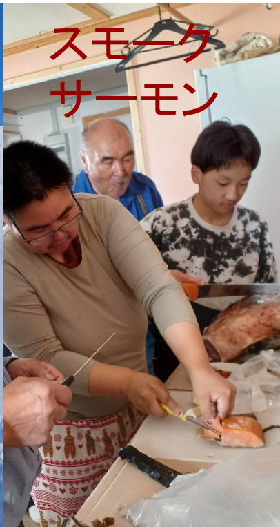
スモーク サーモン